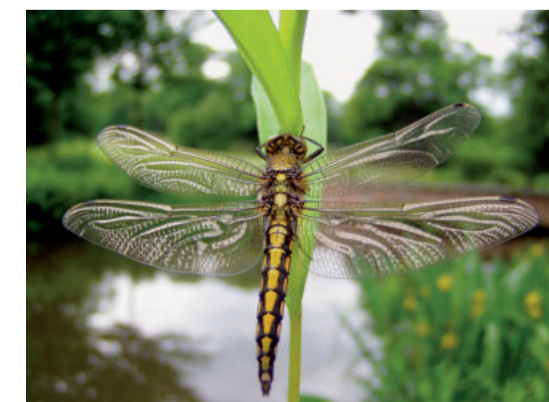
Schaut euch die Schilfhalme genau an! Dort sitzen die Libellen und sonnen sich.

Vor allem im Frühjahr und Sommer finden in den Guttauer Teichen regelrechte Konzertwochen statt. Das ist ein spannender Wettkampf zwischen Laub- und Wasserfröschen, Grasfröschen und Erdkröten, Wechselkröten, Knoblauchkröten und Rotbauchunken. Doch Teichmolch, Zauneidechse und Ringelnatter trauen sich nicht so recht und bleiben als Zuhörer still.