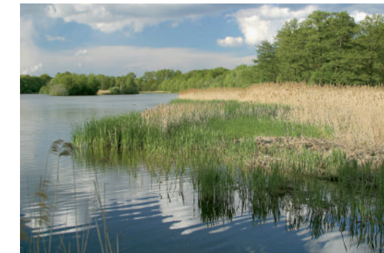
Der Schiffgürtel bietet Schutz für Brutvögel RMS