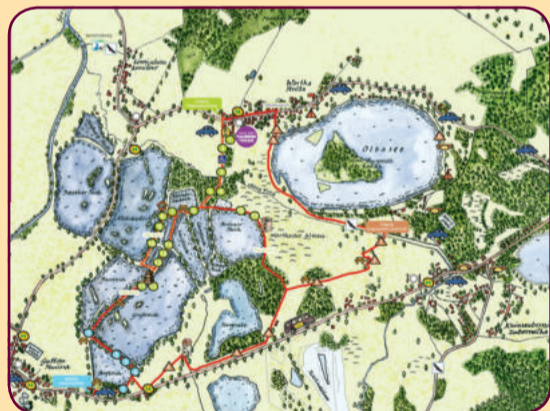
Wer entdeckt zuerst den Fledermaussturm und wer hat schon den Röhrichtsteg gefunden?

In der wundervollen Heide- und Teichlandschaft gibt es zu jeder Jahreszeit etwas zu entdecken! Folgt den verschlungenen Wegen durch die Guttauer Teiche. Die Karte im Faltblatt erleichtert euch unterwegs die Suche nach den Stationen. Und natürlich kann man im Sommer baden – im Olbasee.