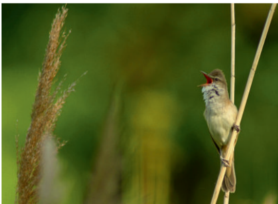
Der Drosselrohrsänger ist oft zu hören, aber selten zu sehen

Ihr seid mitten im zauberhaften Land der tausend Teiche, die wie Edelsteine zwischen Wäldern und Wiesen funkeln. Was denkt ihr, was euch hier erwartet? Es wird spannend – vergesst den Lärm der großen Städte! Hier könnt ihr Natur sehen, hören, riechen und fühlen. Lasst euch faszinieren vom wogenden Röhricht, vom glitzernden Wasserspiegel oder von wolkig weißen Nebelschwaden. Bestaunt im Frühjahr die Blütenteppiche der Buschwindröschen, hört die Rufe der Unkenchöre und die Konzerte ganzer Froschorchester. Erlebt im Herbst das Geschnatter hunderter Wildgänse oder nehmt einfach nur die Stimmung der Teichlandschaft mit ihren riesigen knorrigen Eichen mit!