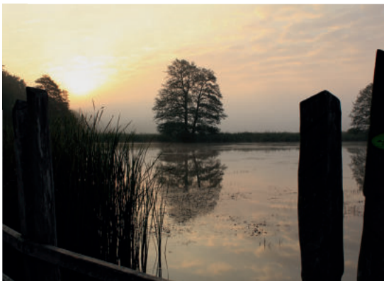
Morgenstimmung an den Teichen OH

STAATSBETRIEB SACHSENFORST Freistaat SACHSEN