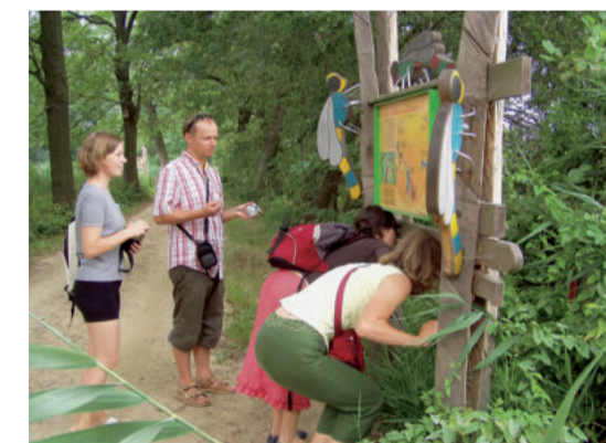
Mit Libellenaugen gesehen AM

Libellen sind mit ihren rasanten Kunstflügen die auffälligsten Insekten der Teichgruppe. Abends tanzen Mücken in großen Schwärmen über den Teichen.