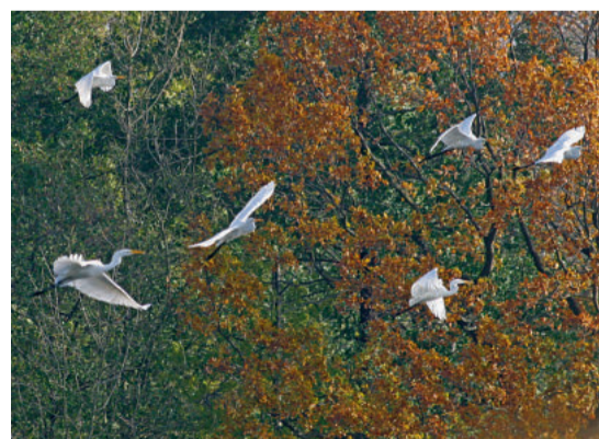
Silberreiher sind häufig zu Besuch in den Teichen RMS

Viele Vogelarten haben hier ihre Kinderstube, wie Hauben- und Zwergtaucher, Höckerschwan, Graugans, Stockente, Schnatterente, Tafelente, Reiherente, Schellente, Rohrweihe, Bläßralle, Teichralle, Teichrohrsänger, Drosselrohrsänger, Beutelmeise, Rohrammer und Eisvogel. Als Nahrungsgäste besuchen uns auch Singschwan, Graureiher, Seeadler, Rotmilan und Schwarzmilan.