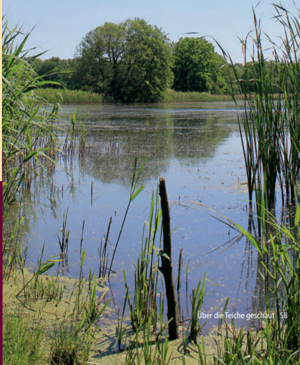
Über die Teiche geschaut