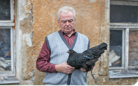
Schwarze Sachsenhennen mit typischem Tütenschwanz