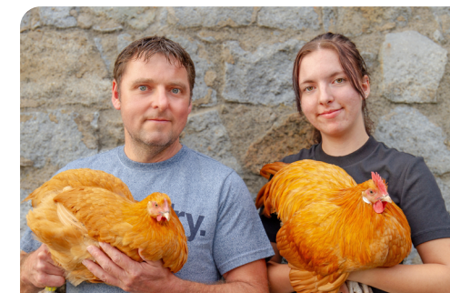
Züchterin und Züchter mit Sachsenhühnern in Gelb

Nur Personen, die selbst züchten und später Bruteier für das Projekt bereitstellen, erhalten diese Musterexemplare. So wird der Grundstein für die langfristige Erhaltung der Rasse gelegt.