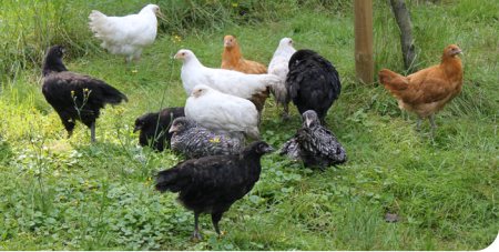
Junghühner in allen vier Farbschlägen