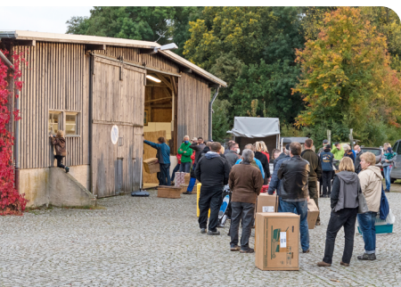
Ausgabe von Sachsenhuhn-Zuchtstämmen auf dem Hof der Biosphärenreservatsverwaltung

Alte Haustierrassen sind lebendiges Kulturgut einer Region. Sie sind an die jeweiligen Bedingungen angepasst und eignen sich gut, die überlieferten Kulturlandschaften durch Nutzung zu bewahren. Deshalb widmen sich auch Biosphärenreservate ihrer Erhaltung. Im UNESCO-Biosphärenreservat Oberlausitzer Heide- und Teichlandschaft beweidet zum Beispiel Moorschnucken, Rotes Höhenvieh und Konik-Pferde die Orchideenwiesen und Heiden. Und seit Jahrhunderten werden im Gebiet Spiegelkarpfen gezüchtet, wodurch der Fortbestand der Teiche gesichert wird.