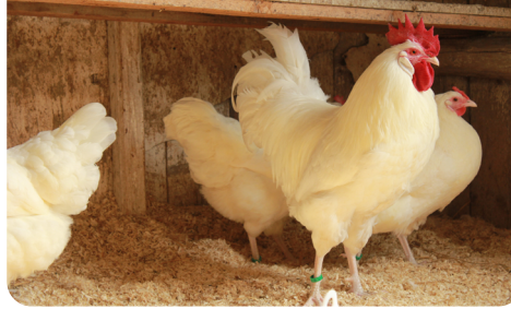
Sachsenhühner im Farbschlag weiß