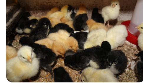
Drei Tage alte Küken aller Farbschläge