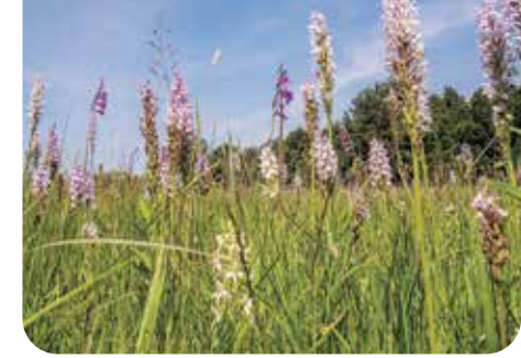
Wiese mit Geflecktem Knabenkraut und Wiesen-Gladiole

Verschollene Wiesenpflanzen: Sumpf-Siegwurz, Kleines Knabenkraut, Fleischrotes Knabenkraut, Sumpf-Herzblatt, Sumpf-Läusekraut