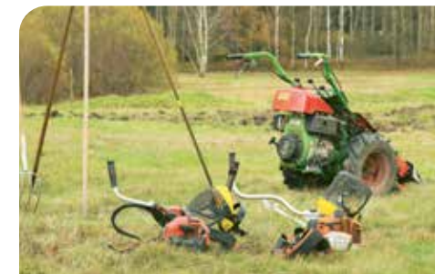
Technik zur Pflege der Gladiolenwiese

Damit beschäftigen sich Forschungsprojekte. Auch Versuche zur Umsetzung und Wiederansiedlung der Arten an geeigneten Standorten laufen aktuell. Bei der Wiesen-Gladiole klappt das am besten durch das Auspflanzen von vorher vermehrten Zwiebeln. Bei Orchideen werden Pflanzungen und Aussaaten erprobt.