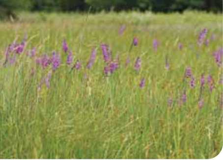
Die Gladiolenwiese im Daubaner Wald – Naturwunder 2017