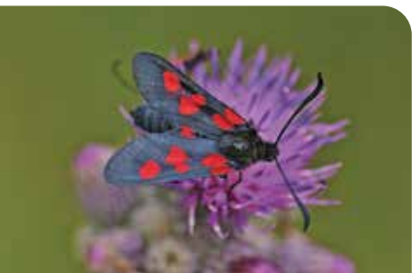
Sumpfhornklee-Widderchen auf Sumpf-Kratzdistel

Das größte deutsche Vorkommen der Wiesen-Gladiole liegt im Biosphärenreservat auf der DBU-Naturerbestfläche „Daubaner Wald“. Diese Gladiolenwiese wurde in einem deutschlandweiten Wettbewerb der Heinz-Sielmann-Stiftung und des Europarc Deutschland e.V. als Naturwunder 2017 zur schönsten Wiese Deutschlands gewählt.